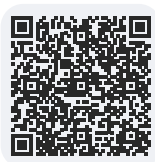
Offres de formation Maritime