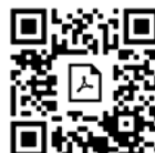
PDF Guide alternance